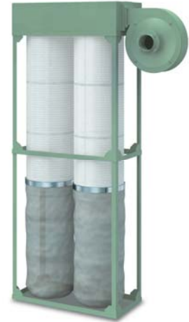
【ダストコレクター／TYPE：DST】